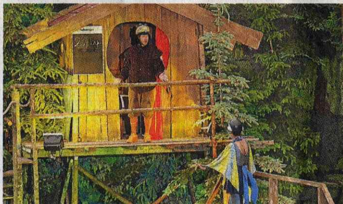
Hoch oben im Baum hat der Kuckuck sein Kuckuckshaus.