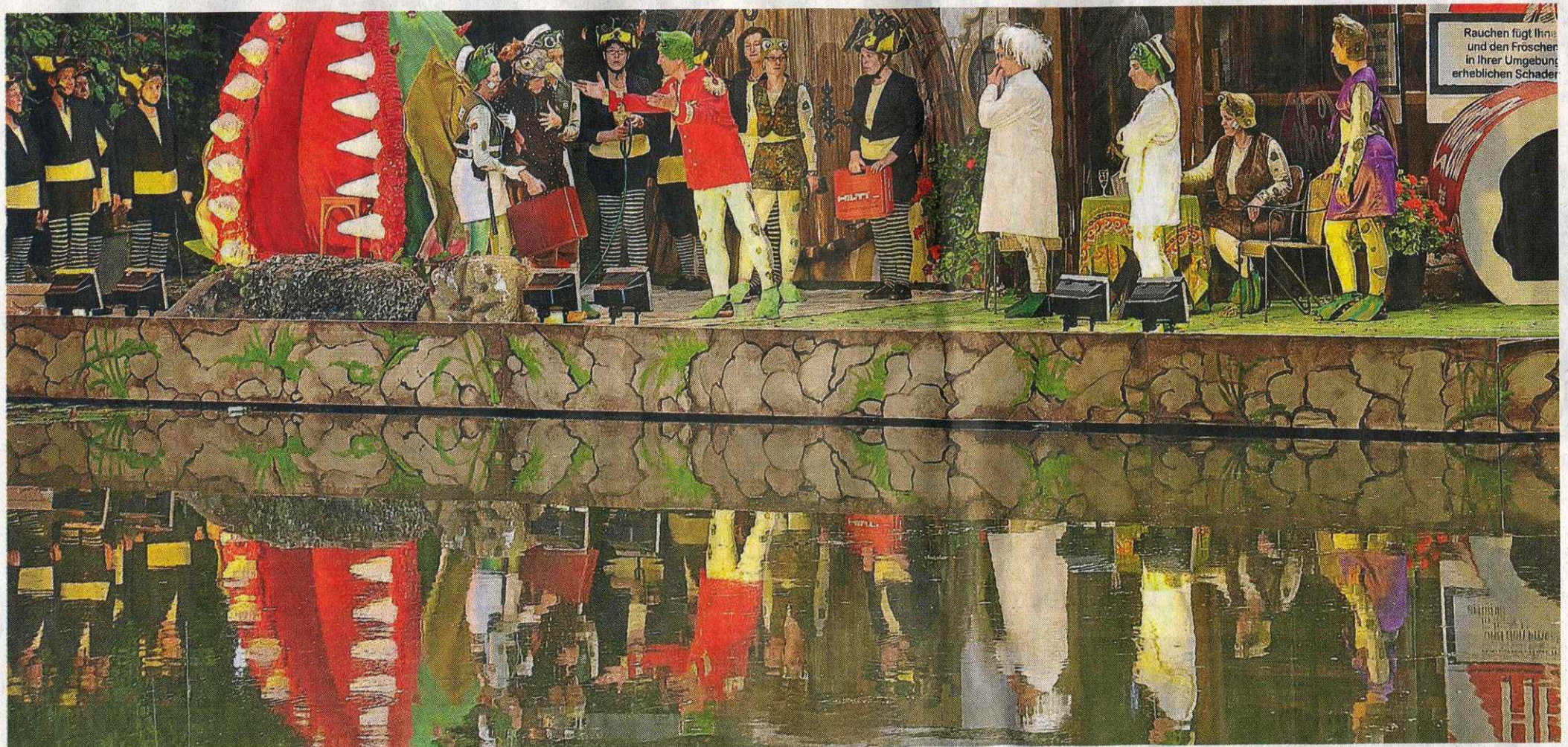
Teichgeflüster am Weiher: In diesem Jahr beweisen die Frösche und alle anderen Tiere, dass sie die gleichen Sorgen haben wie die Menschen.

Eine sensationelle Premiere feierten die Weiherspiele in Markt Schwaben. In dem Stück „Teichgeflüster“ beweisen die Macher, dass Frösche mit den gleichen Problemen zu kämpfen haben wie die Menschen. Wie stelle ich es an, ein anerkanntes Staatsoberhaupt zu werden? Wie bekomme ich die Liebe meines Lebens? Und kann ich mit dem Verkauf einer Erfindung an ausländische Investoren den Staat vor der Überschuldung retten?